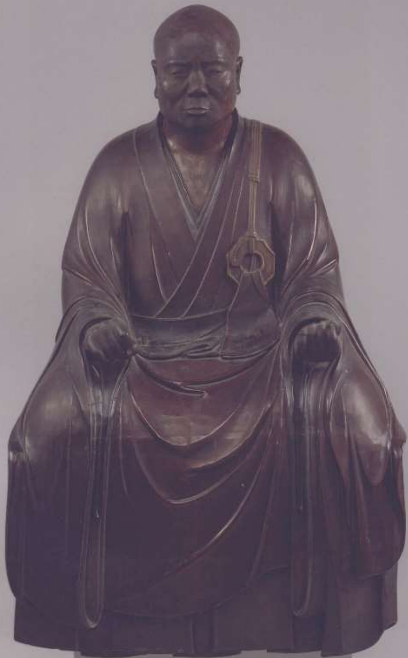
瑩山紹瑾座像 永光寺 ようこうじ所蔵 鎌倉時代 正中二年(一三二五)銘 高さ 76,4 cm