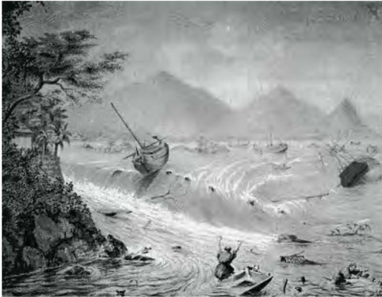
モジャエスキー ディアナ号 安政東海地震