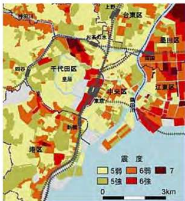
関東大震災の震度分布

一方で、 本郷などの台地、かつて砂州だった日本橋や銀座周辺 は揺れが小さかった。大手町から虎ノ門にかけて揺れが大きかった地域には、気象庁や東京消防庁、警視庁、総務省など地震の初動に欠かせない官庁、日本経済に大きな影響を与える大企業が並ぶ。