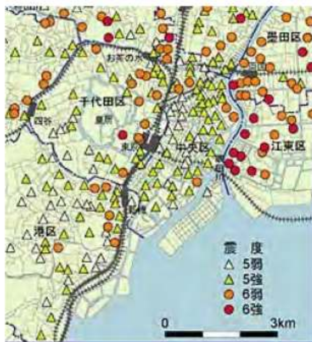
安政江戸地震の震度分布