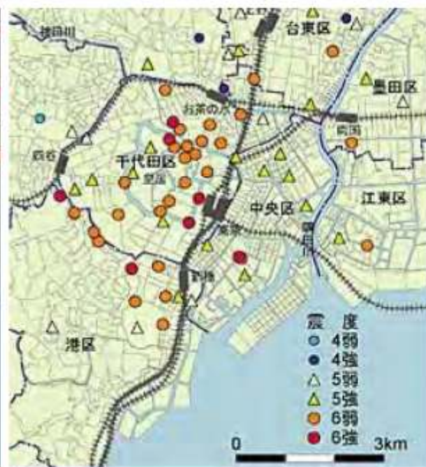
元禄関東地震の震度分布