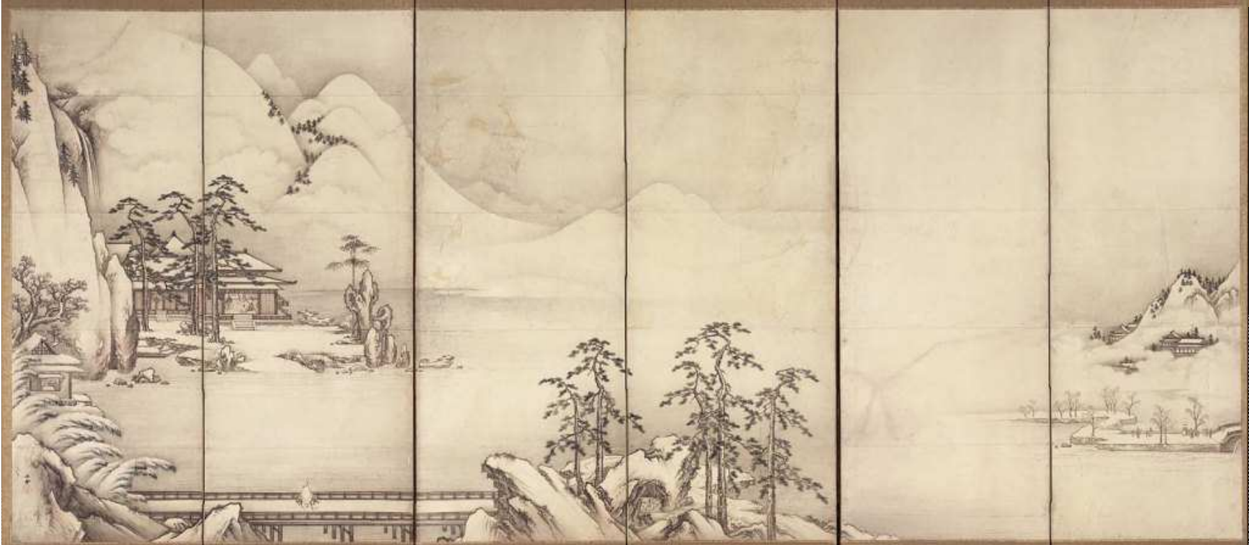
狩野山雪 十雪図屏風 江戸時代 17世紀前半