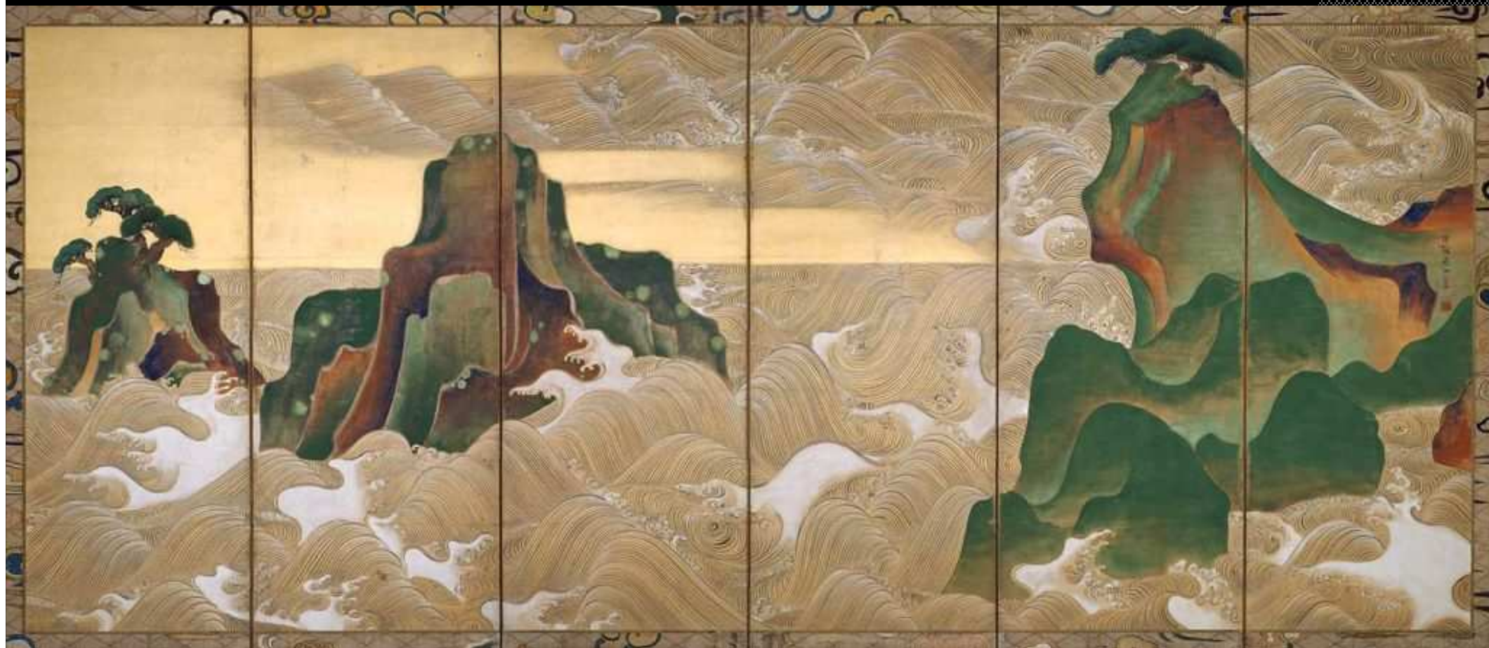
尾形光琳 松島図屏風 江戸時代 18世紀