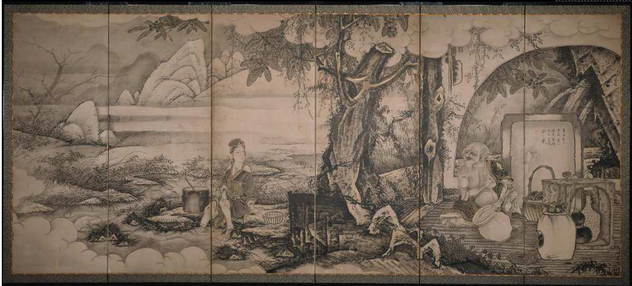
曾我蕭白 龐居士・靈昭女図屏風（見立久米仙人） 宝曆9年（1759）