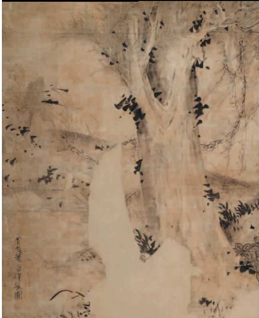
曾我蕭白 江戸時代