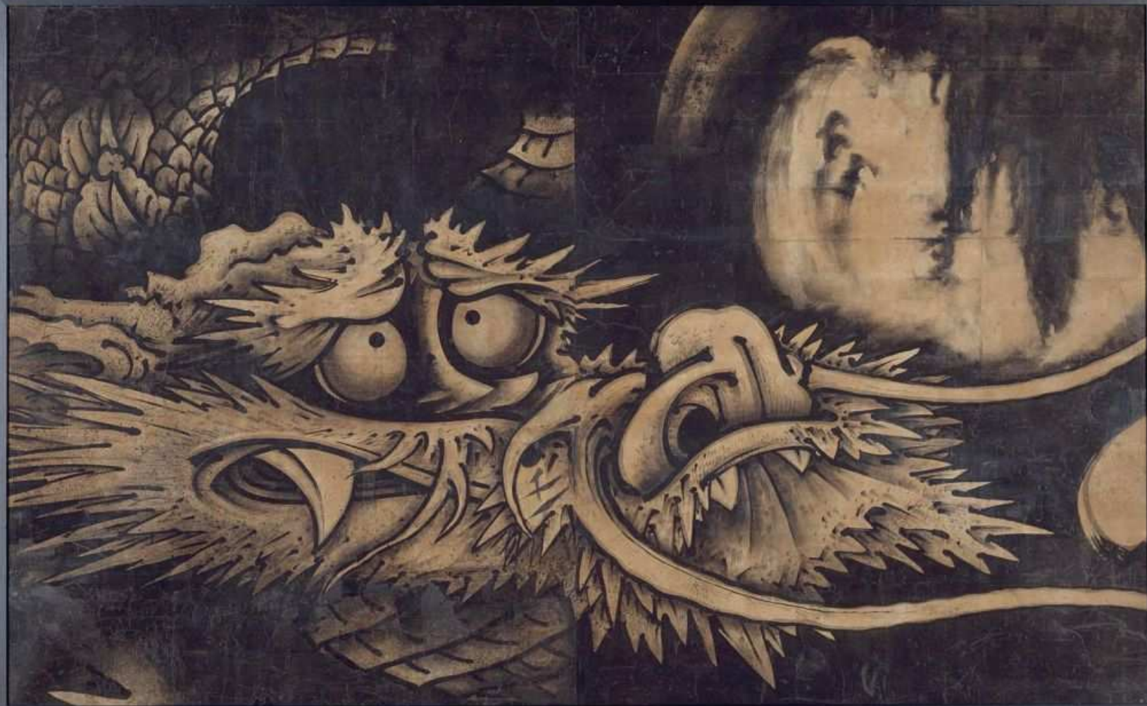
曾我蕭白 雲龍圖 ● ● 宝曆13年(1763)