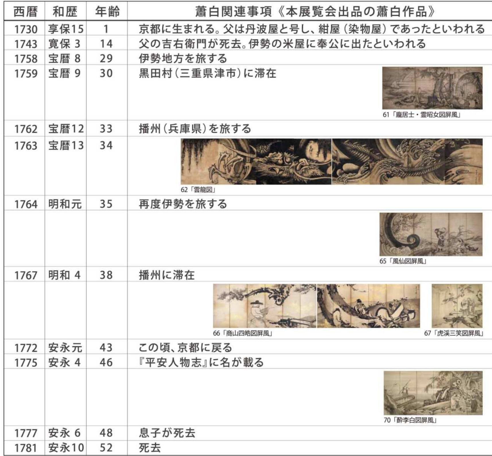
61 「麻居士・靈昭女図屏風」