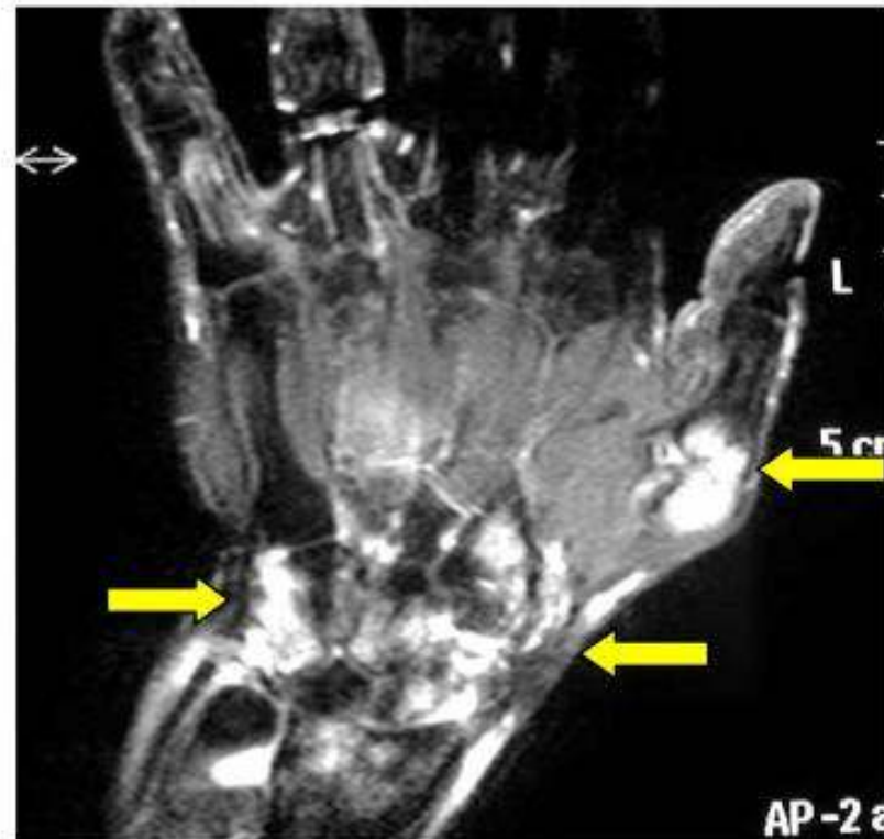
MRI画像（T1 脂肪抑制 Gdエンハンス）