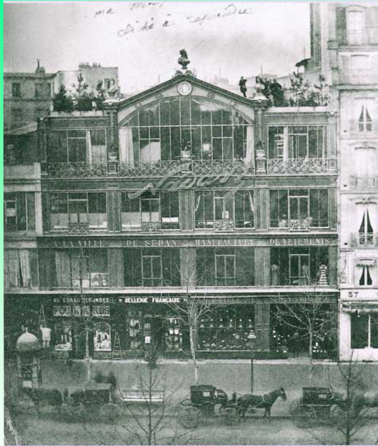
ナダールのスタジオ