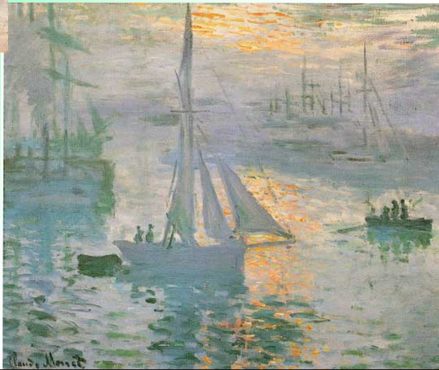
《日の出（海）》1873年 個人蔵（パリ）