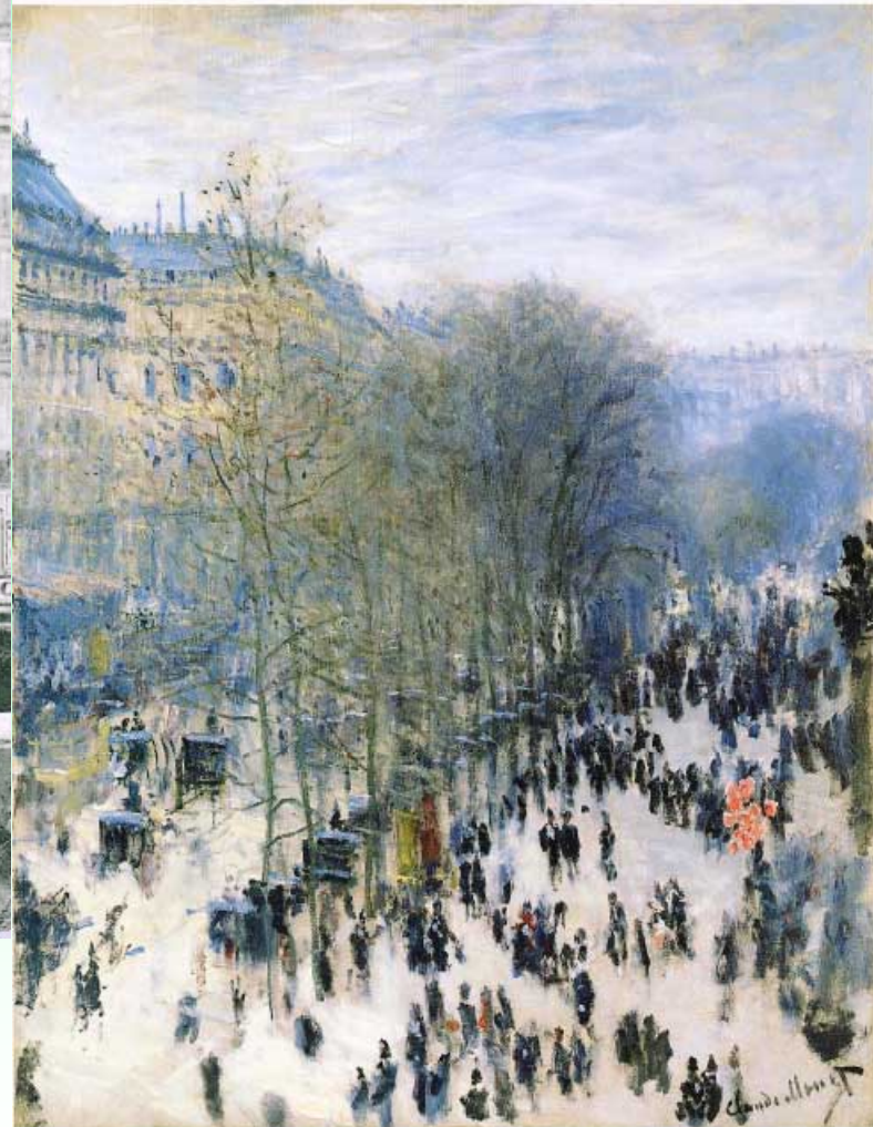
《キャプシーヌ大通り》1873年