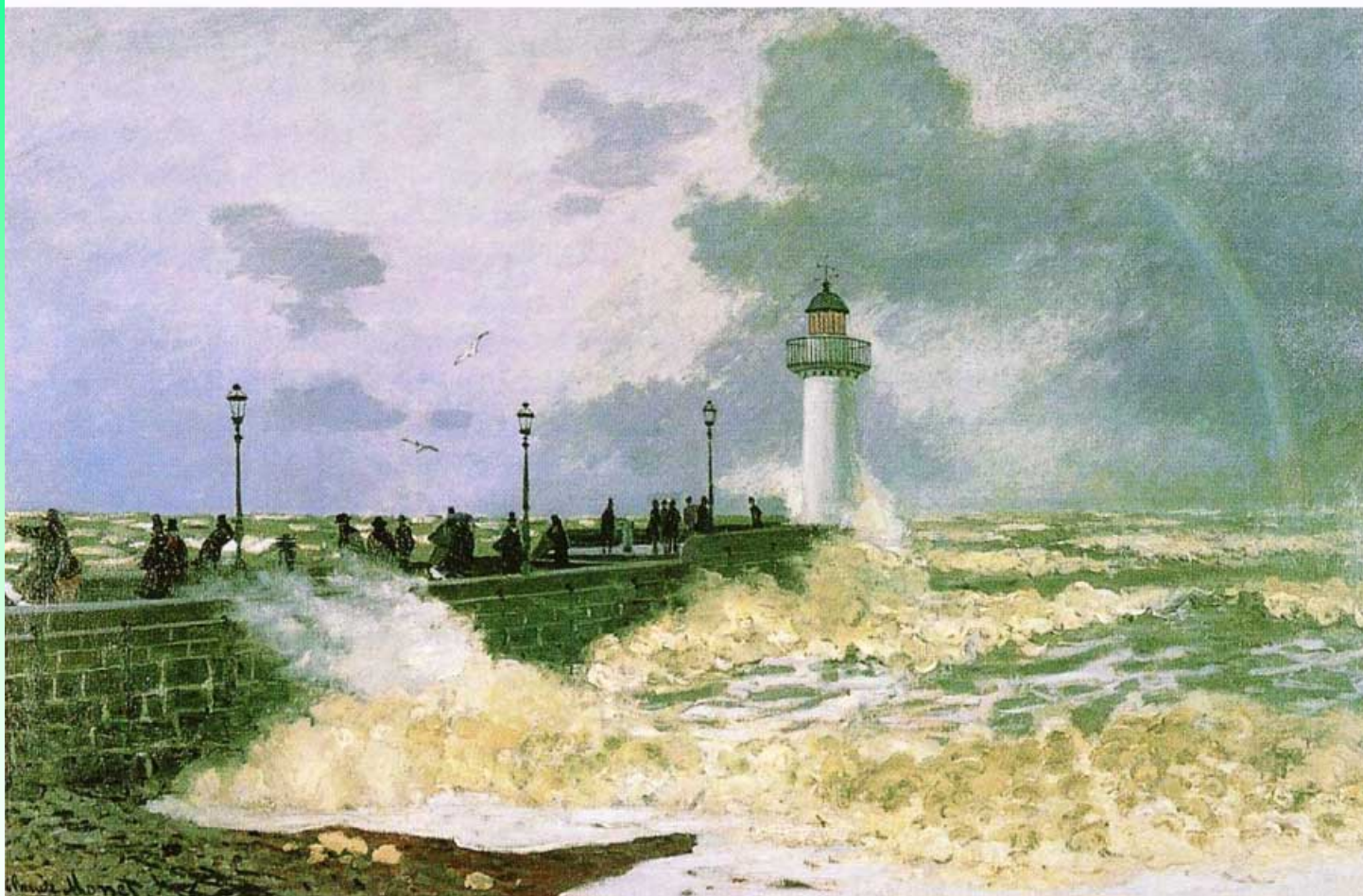
モネ 《荒天のル・アーヴル》 1867-68年