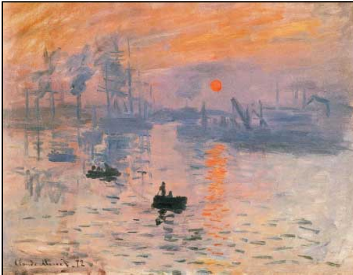
《印象 日の出》1873年 マルモッタン美術館