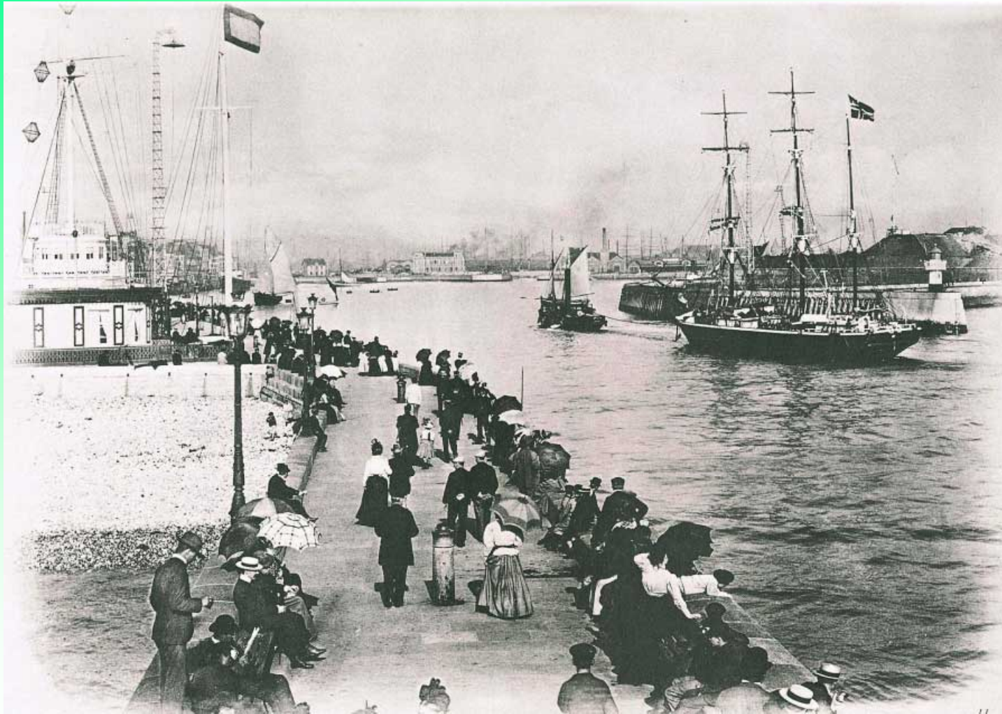
ル・アーヴル港、1900年頃